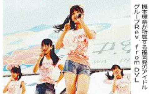
橋本環奈が所属する福岡発のアイドルグループRev. from DVL