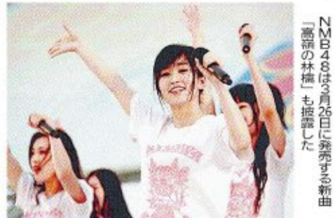
NMB48は3月26日に発売する新曲「高橋の林檎」も披露した

マジン(想像)している愛菜ちゃんを楽しんでもらう映画になっていくと思えますね」声田「台本がすごく面白くて、こっこちゃんが好きでかわいかったです。早く撮影が始まらないかなどワクワクしてました。撮影は去年の夏で、私も3年生だったので、同じ気持ちになって頑張るぞ！」